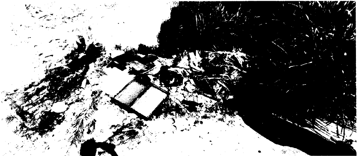
CORREGO OIAPOQUE - AV JULIO SIMÕES AO LADO DO NÚMERO, 900- JARDIM MODELO - MOGI DAS CRUZES.